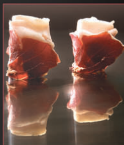
PALETA IBÉRICA VALTURRA VALTURRA IBERIAN SHOULDER

Es el resultado de un largo y cuidado proceso de elaboración, con una curación mínima de veinticuatro meses. La carne magra entre rojo púrpura y rosa pálido con brillantes vetas blancas infiltradas posee un delicado aroma a bellota y un intenso sabor lleno de matices.