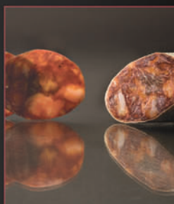
CHORIZO IBÉRICO VALTURRA VALTURRA IBERIAN CHORIZO

El salchichón se elabora a partir de una selección de las partes magras del cerdo que, al combinarlas con sal, pimienta y nuez moscada, se logra un agradable sabor final a carne magra.