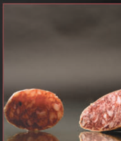
SALCHICHÓN IBÉRICO VALTURRA VALTURRA IBERIAN SALCHICHÓN

El lomo del cerdo ibérico se elabora con sal, pimentón y ajo. Después es embuchado en tripa natural. Con una curación de cuatro meses, el producto final es una carne magra, de textura fina, con una infiltración grasa que aporta al producto aroma a bellota y gran jugosidad.