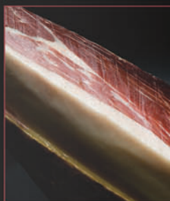
JAMÓN IBÉRICO VALTURRA VALTURRA IBERIAN HAM

Es el resultado de un largo y cuidado proceso de elaboración, con una curación mínima de veinticuatro meses. La carne magra entre rojo púrpura y rosa pálido con brillantes vetas blancas infiltradas posee un delicado aroma a bellota y un intenso sabor lleno de matices.