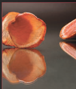
LOMO IBÉRICO VALTURRA VALTURRA IBERIAN LOIN

Su período de curación es de quince meses. Es una pieza de menor tamaño que con su tonalidad rosada posee una carne de untuoso y jugoso sabor.